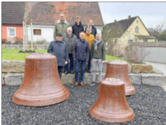
Regionalbudget Projekt: Aufstellung der alten Kirchenglocken der St. Nikolaus Kirche in Mitteleschenbach.