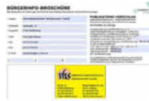
Bild zur Meldung: Achtung! - Unseriöse Anzeigenangebote zur Veröffentlichung einer Werbeanzeige in einer angeblichen Bürgerinfo-Broschüre durch die Firma Vision Graphic Media LLC

Achtung! - Unseriöse Anzeigenangebote zur Veröffentlichung einer Werbeanzeige in einer angeblichen Bürgerinfo-Broschüre durch die Firma Vision Graphic Media LLC